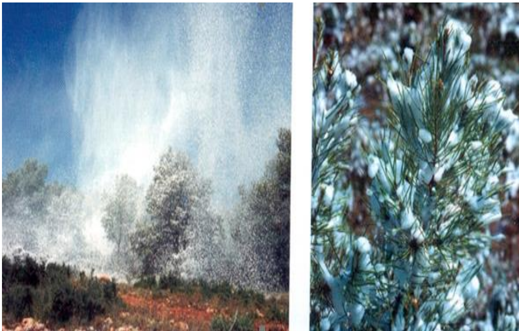
Slika 13: Prekrivanje vegetacije pjenom

Nedostaci pjene klase A: prestaje djelovati kada voda ispari, mogu nadražujuće djelovati na kožu i oči, korozivne su prema nekim metalima i mogu ubrzati propadanje nekih vrsta brtvenih materijala, visoka koncentracija može imati negativni ekološki utjecaj na okoliš.