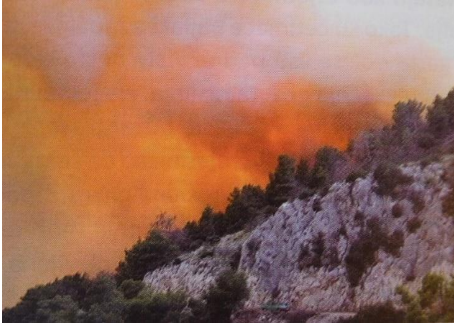
Slika 4: Žestina požara - ekstremna