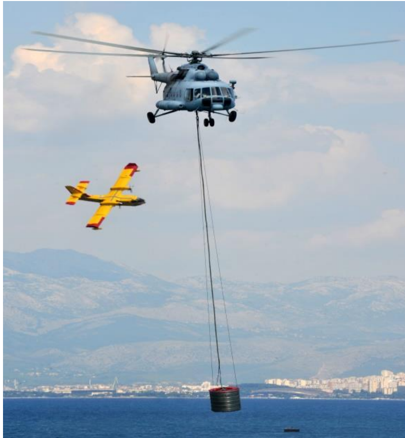
Slika 28. Helikopter MI-8 [9]

MI-8 je transportni helikopter s osnovnom namjenom za prevoženje ljudstva i materijalno-tehničkih stvari i za gašenje požara s pomoću „kruške“. Vrlo je učinkovit u dopremi ljudstva i sredstava na teško pristupne lokacije. (slika 28.)