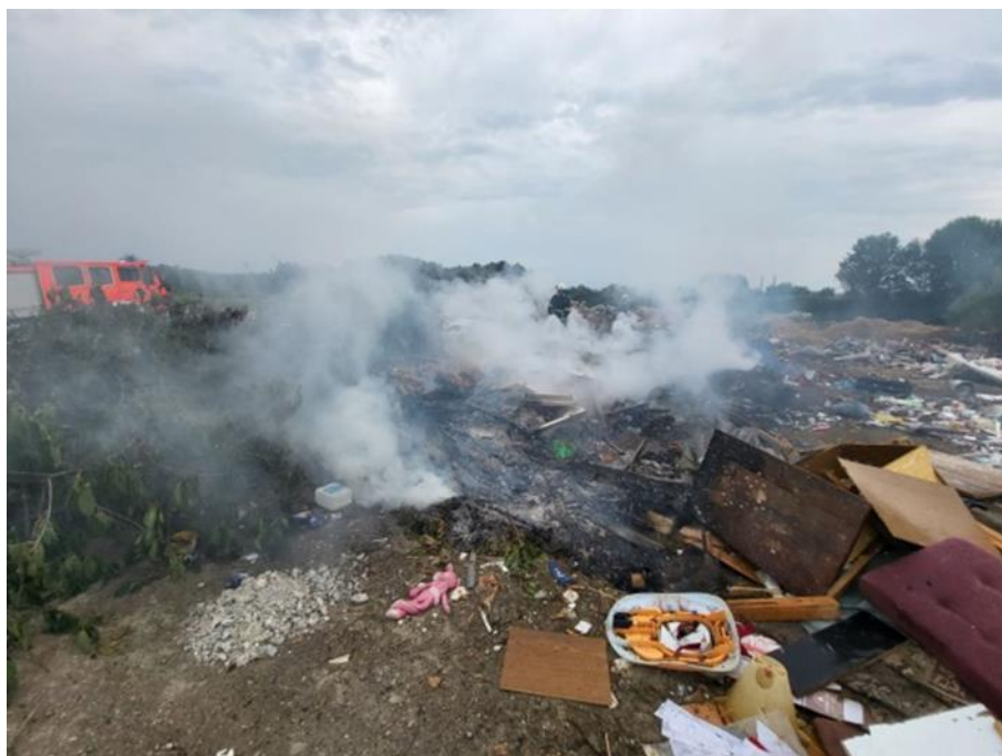
Slika 34. Sekundarno požarište [14]