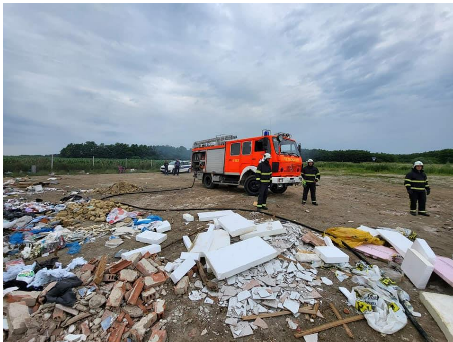
Slika 35. Završetak intervencije [14]

DVD Nova Ves je dobio zadatak postaviti nove cijevne pruge do novonastalog požara na odlagalištu kako bi se spriječilo daljnje širenje požara. U blizini centra požara pripadnici DVD-a Nova Ves uočili su nepropisno odložene spremnike opasnog otpada. U nedostatku informacija o vrsti otpada te jesu li spremnici potencijalni izvor eksplozija i daljnjeg širenja požara, žurno se pristupa gašenju sekundarnog požara kako bi se izbjegla dalja šteta. Korištena je ista taktika zaokruživanja požara te se pravodobnom intervencijom uspješno izbjeglo širenje sekundarnog požara (slika 35.)